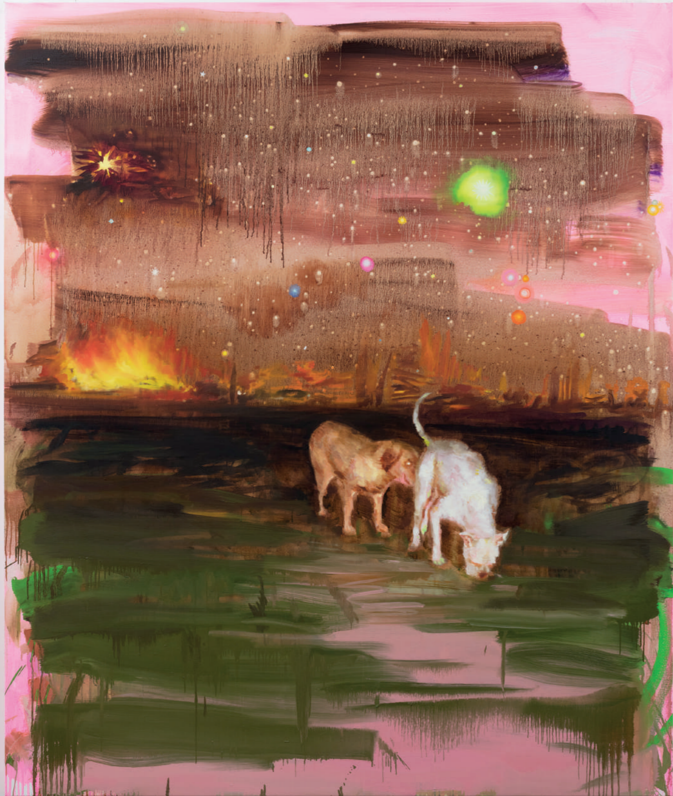
Vue d'atelier © Tursic & Mille