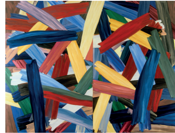
Alain Clément, 97 JA 6P , 1997. Don de l'artiste en 2024. © ADAGP, Paris 2026