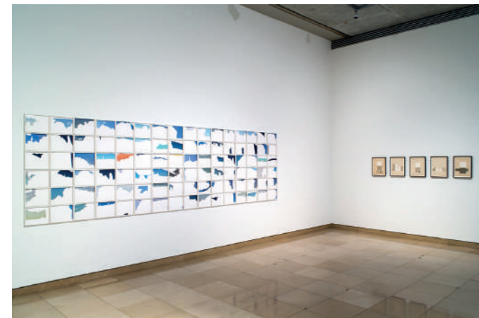
Walid Raad, Rayyane Tabet. © W. Raad, R. Tabet

Constituée à partir de 1986, la collection du musée réunit près de 700 oeuvres de 1960 à nos jours. Ce nouveau parcours dans les collections met l'accent sur les groupes Supports/Surfaces et ABC avec un focus particulier sur la récente donation d'Alain Clément. Il présente également de nouvelles générations d'artistes qui interrogent le sujet de la frontière et de la migration.