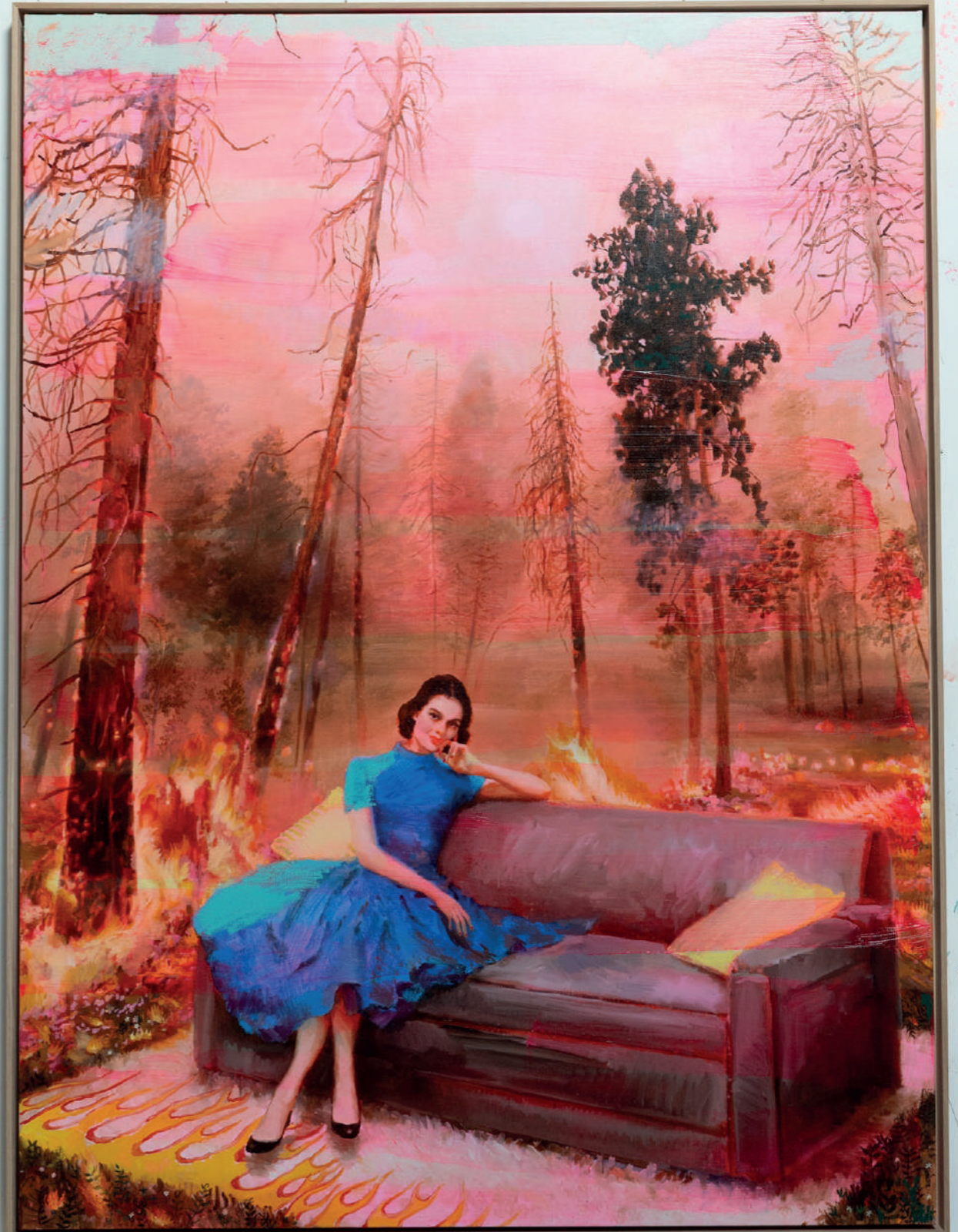
Mélancolie , 2025, huile et bâton d'huile sur toile, 204 x 154 x 6 cm. © Tursic & Mille, courtesy des artistes et galerie Max Hetzler Berlin | Paris | London | Marfa

IT & WM Ce tableau se situe dans la dernière salle de l'exposition, après le flux de la salle rose, comme un temps de décantation. La dissonance ne tient pas ici à la catastrophe elle-même, mais au calme étrange qui habite la scène, à l'absence d'urgence, au décalage entre la violence du paysage et la posture de la figure, comme si l'incendie faisait maintenant partie du décor. Il s'inscrit dans un ensemble de peintures où la catastrophe ne fonctionne plus comme un événement, mais comme un état latent, voire métaphysique. Une maison brûle, des chiens poursuivent leur conversation sous un ciel étoilé, une figure humaine est posée dans un monde qui lui est indifférent, et cette femme, confortablement installée, qui nous regarde. Ces situations ne racontent pas une histoire : elles décrivent différentes positions possibles dans un monde instable, marqué par une désynchronisation entre l'événement et la réaction. La peinture maintient cet état intermédiaire, cet entre-deux (In Between) où rien ne s'effondre complètement, mais où tout continue malgré tout.