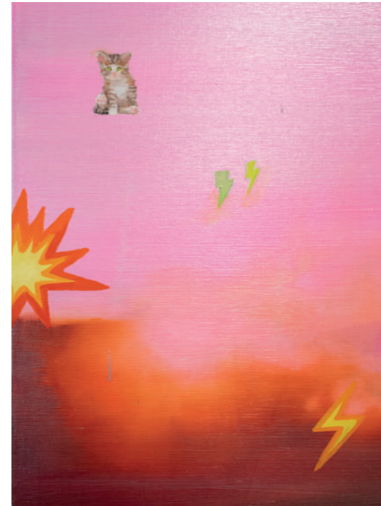
Sans titre, détail, 2026