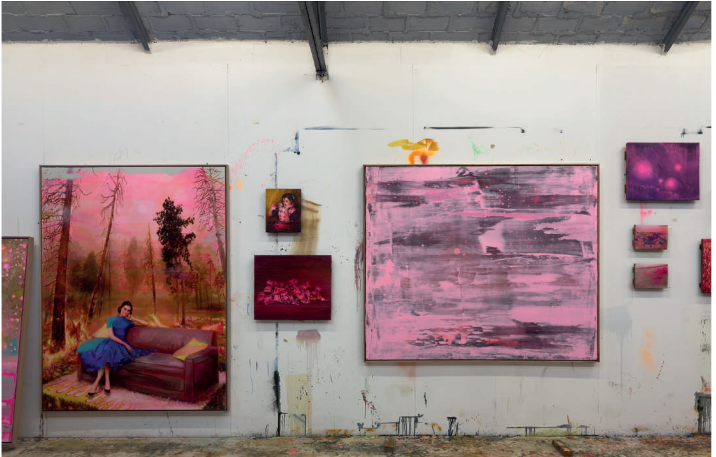
Vue d'atelier © Tursic & Mille