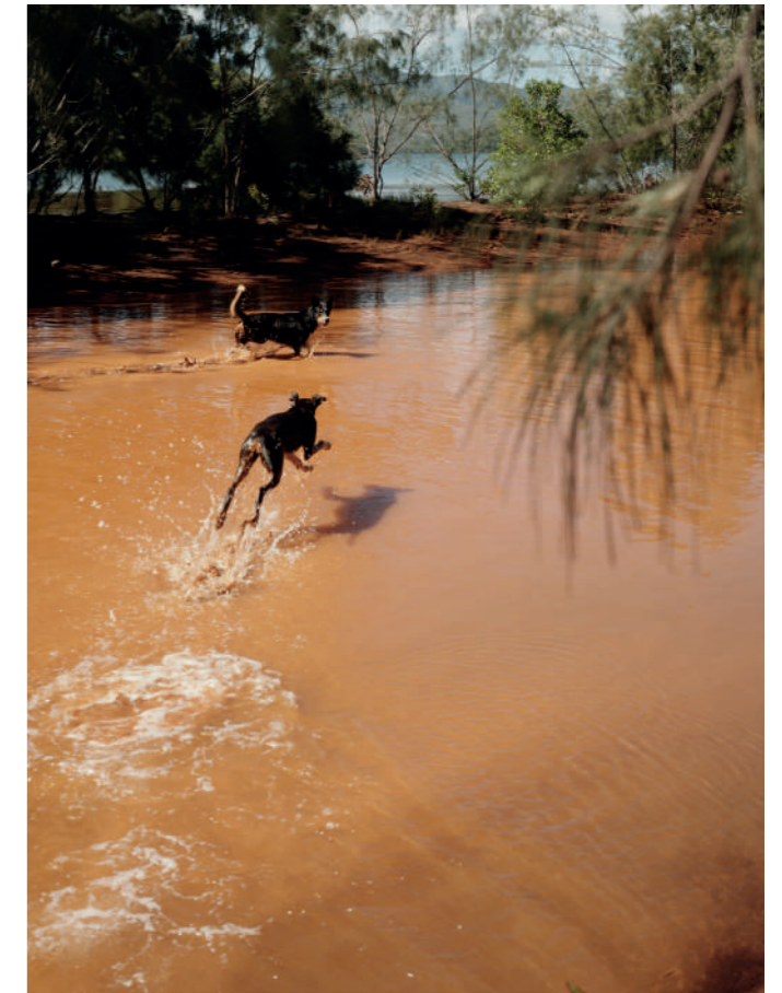
Sébastien Arrighi, Prony , 2025. Courtesy de l'artiste © Sébastien Arrighi

Sébastien Arrighi, Breast , 2021. Courtesy de l'artiste © Sébastien Arrighi