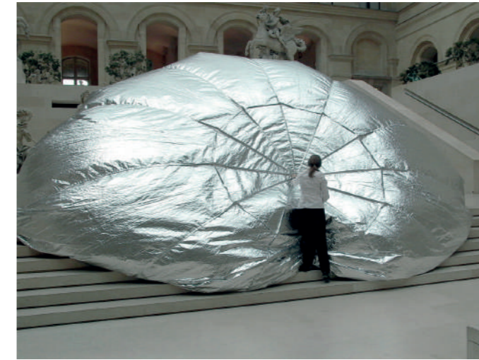
Marie-Ange Guillemot, L'Oursin , performance du 12 novembre 2004. Salle des Chevaux de Marly dans l'exposition "Contrepoint, l'art contemporain au Louvre", Musée du Louvre, Paris. Collection de l'artiste.

Exposition du 7 novembre 2026 à mars 2027