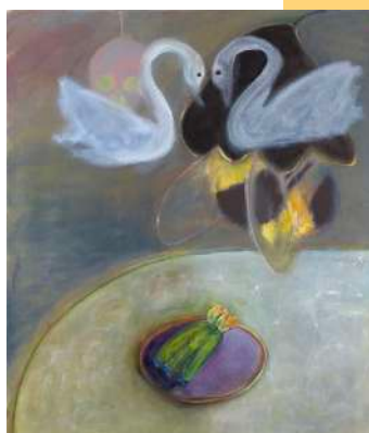
Unstuck , 2022, huile sur lin, 150 x 130 cm.