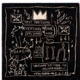
Pochette d'album créée par Jean-Michel BASQUIAT , beat Bop record , 1983