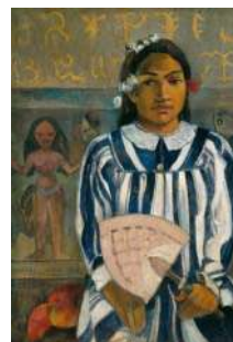
Paul GAUGUIN Teha'amana a plusieurs parents , 1893