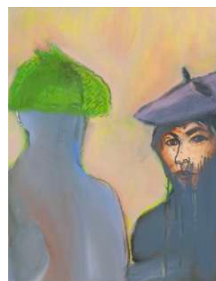
Elena and Gintaras At The Market, 2021, huile sur toile, 60x40cm.

Ce dossier pédagogique permet un éclairage en lien avec les programmes du secondaire en arts plastiques en particulier.