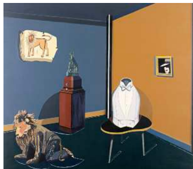
Eduardo ARROYO , José-Maria Blanco White guetté au British museum , 1978. Huile sur toile, 200 x 230cm.