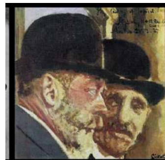
Walter SICKERT King George V and his Racing Manager: A Conversation Piece at Aintree , 1927

À visiter en + Jusqu'au 29 janvier 2023, exposition Peindre et transgresser Walter SICKERT , au musée du Petit Palais, à Paris