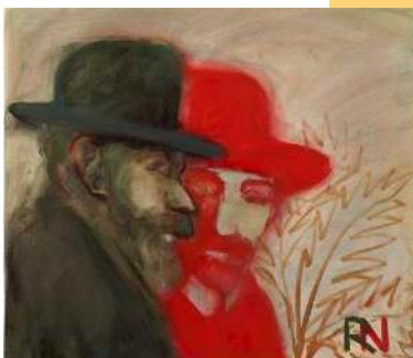
My Demons (after Sickert) , 2022, huile sur toile, 60 x 70 cm.