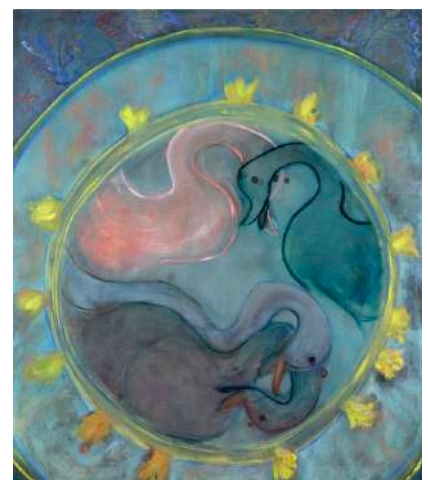
Fall against the Glass, 2022, huile sur toile, 150 X 130cm.

https://www.youtube.com/channel/UCo9pAtonJmmcEQ0aXG-U5GQ