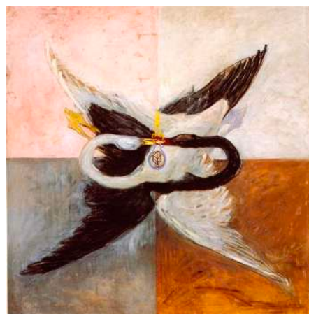
Hilma Af KLINT Svanen , 1914.