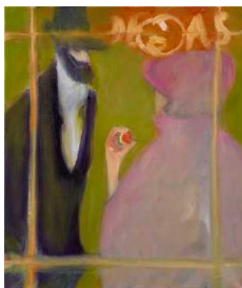
The Golden Age , 2022, huile sur lin, 70 x 60 cm.