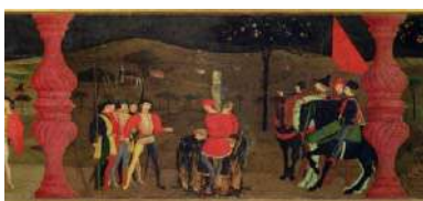
Paolo UCELLO Le Miracle de l'Hostie profanée, (détail d'une des 6 scènes de la prédelle), 1467-69.