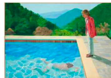
David HOCKNEY Portrait of an Artist (Pool with Two Figures) , 1972