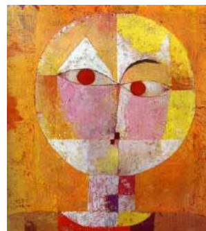
Paul KLEE Senecio , 1922.