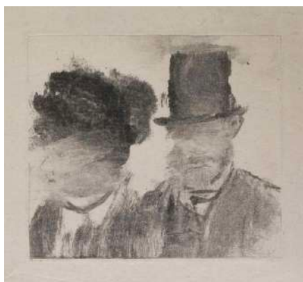
Edgar DEGAS Heads of a Man and a Woman ( Homme et femme, en buste ), vers 1877-80.

La forme de votre production artistique s'adaptera à vos choix plastiques et votre intention. Exposez votre production aboutie en regard de vos recherches.