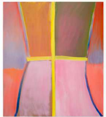
Verso II , 2021, Huile sur toile, 150 x 130cm.