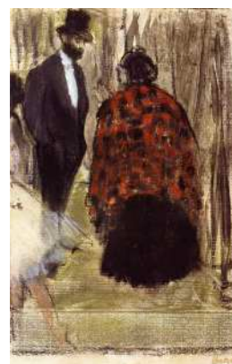
Edgar DEGAS Ludovic Halevy Speaking with Cardinal , 1876-1877.