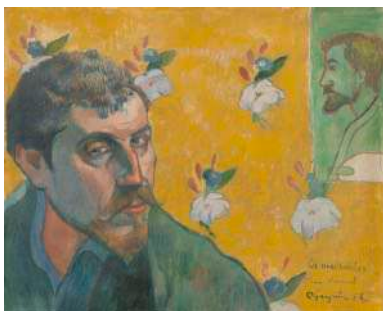
Paul GAUGUIN Autoportrait , 1888.