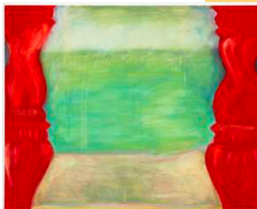
Red Portal, Green Pool , 2019, pigment sur toile, 120 x 150 cm.