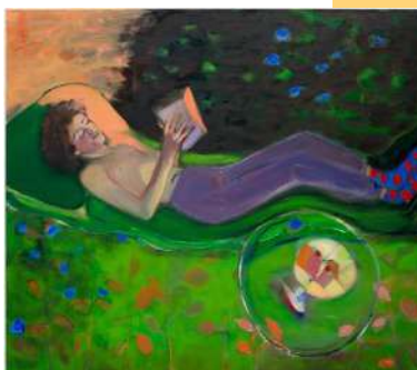
Boy Fizzing , 2021, huile sur lin, 130 x 150 cm.