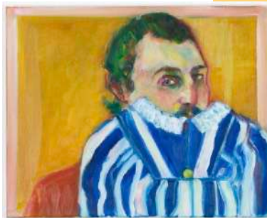
Untitled (PG) , 2020, huile sur toile 40 x 50 cm