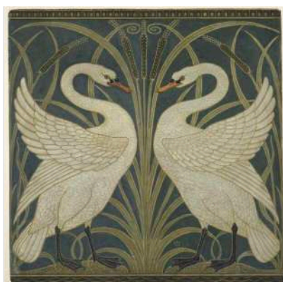
Walter CRANE Swan, rush and Iris , 1875, Papier peint, Victoria & Albert museum.