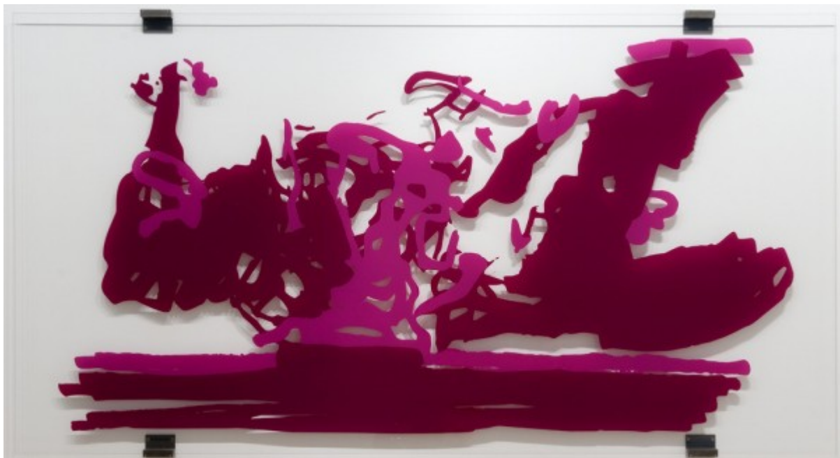
Panorama Gust 2000

Autour d'une œuvre de Jean-Marc BUSTAMANTE