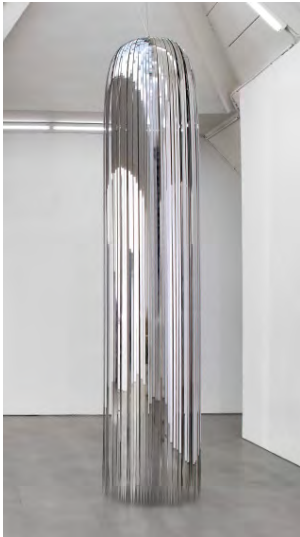
Father Form, 2017