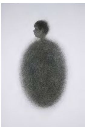
Open Window, 2020