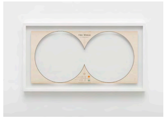
The World, 2014