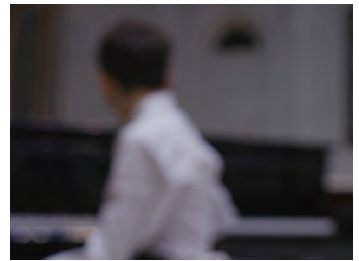
The Custom House/The Reading Room, 2020