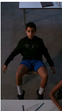
Out of Place, 2020