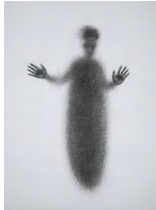
The Window, 2020