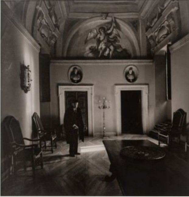
Famille Boncompagni Ludovisi Rome, 1986