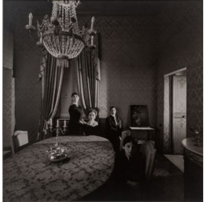
Famille Moncada di Paterno Rome, 1987