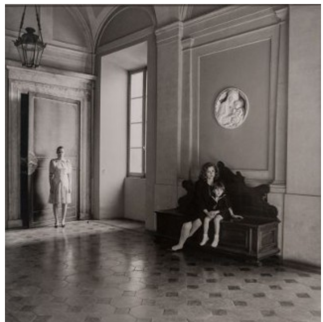
Famille Aldobrandini, Rome 1986