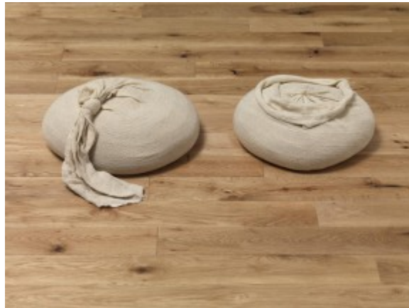
Barry Flanagan , Sand muslin mousseline remplie de sable, 1966