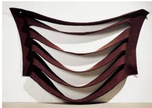
Robert Morris , Wall hanging pièce de feutre suspendu au mur, 1969-1970