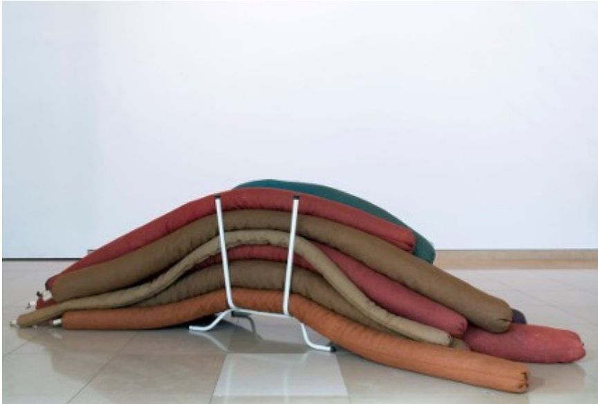
Rack, 1967 - 1968 Toile de jute, polystyrène, armature en métal 307 x 175 x 76 cm

1941, Prestatyn (Royaume-Uni) - 2009, Ibiza (Espagne)