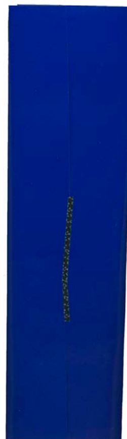
Dool #22 , 2017, papier.