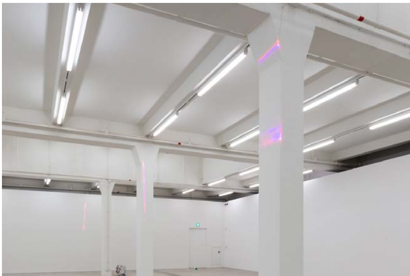
Feyon 17 , 2018, laser.