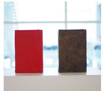
B. Lavier «Or not to be»

Suite à une approche émotionnelle, puis un balisage pas à pas vers la connaissance plus théorique, historique et sociologique de ces 4 œuvres (visite guidée, sensibilisation à l'usage du Fond Documentaire Régional), les élèves ont valorisé la production témoignant le plus «d'intérêt» pour leurs sensibilités de lycéens.