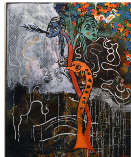
S. Polke «Quatre Saisons»