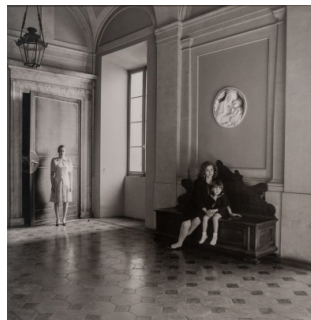
P. Faigenbaum «Familles»