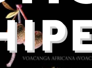
VOACANGA AFRICANA (VOACANGA)