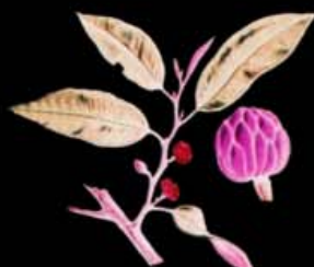
GALBULIMIMA BELGRAVEANA (AGARA)

CARRÉ D'ART - MUSÉE D'ART CONTEMPORAIN NÎMES