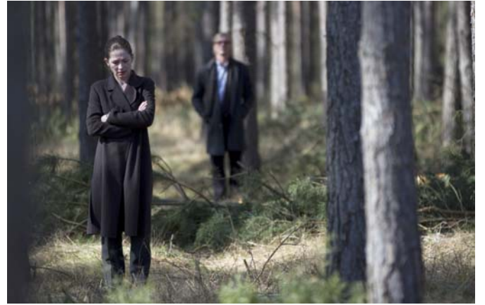
OMER FAST Continuity, 2012