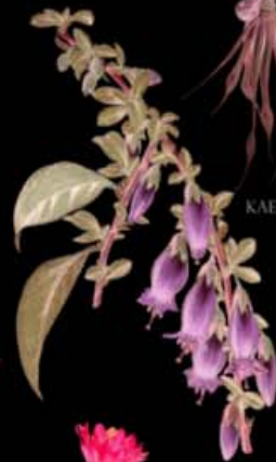
LATUA PUBIFLORA (LATUI)

CARRÉ D'ART - MUSÉE D'ART CONTEMPORAIN NÎMES