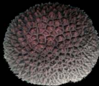
LYCOPERDON MARGINATUM (GF-WA)