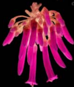
IOCHROMA FUCHSIOIDES (PAGLIANDO)