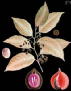
MYRISTICA FRAGRANS (NUTMEG)