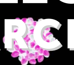
RHYNCHOSIA LONGIERACEMOSA (PILI)