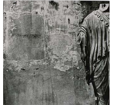
CHRISTIAN MILOVANOFF Statue féminine antique de Nîmes, La Vénus de Nîmes, 1987