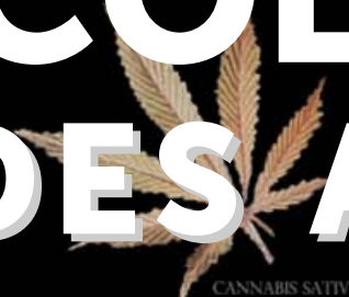
CANNABIS SATIVA (MARIJUANA)