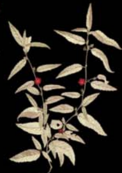
SIDA ACUTA (MALVA COLORADA)