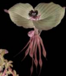
KAEMPFERIA GALANG (GALANGA)