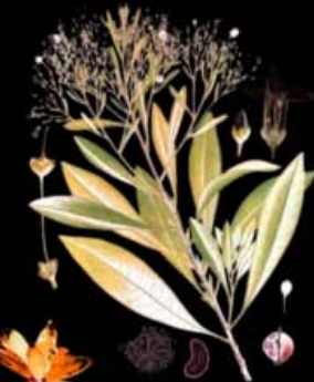
DUBOISIA HOPWOODII (PITURI)