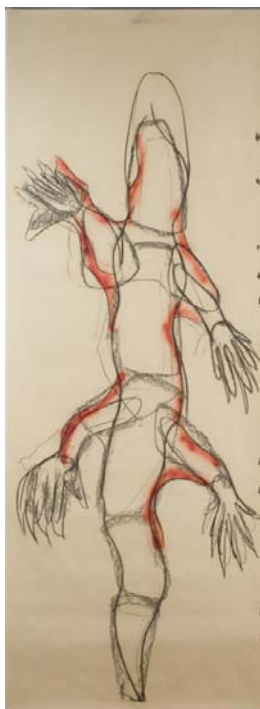
MARIO MERZ Senza titolo (coccodrillo), 1997-2000