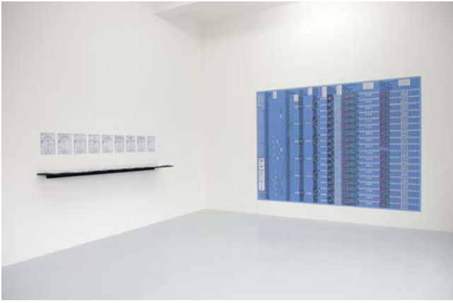
LAWRENCE ABU HAMDAN Conflicted Phonemes, 2012