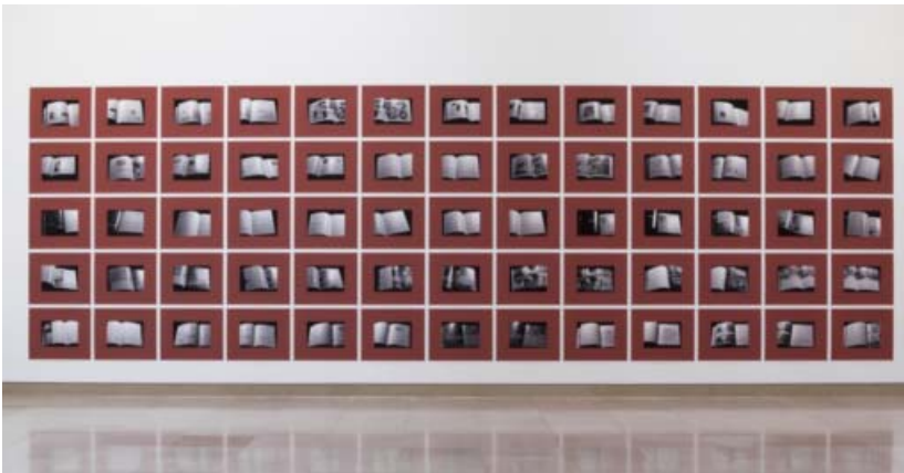
SUZANNE LAFONT , The First Two Hundred Fifty-Five Pages of Project on the City 2 , Harvard Design School, GUIDE TO SHOPPING , Supervised by Chuihua Judy Chung, Jeffrey Inaba, Rem Koolhaas, Sze Tsung Leong, Taschen publishers, 2001, 2014