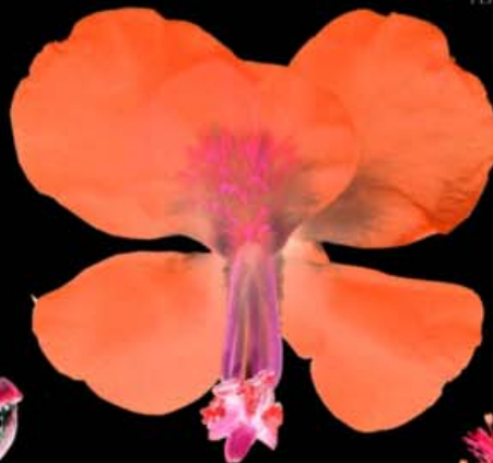
CAESALPINIA SEPIARIA (YUIN-SHIH)