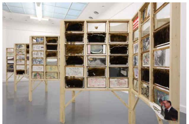
The Salt Traders, 2015