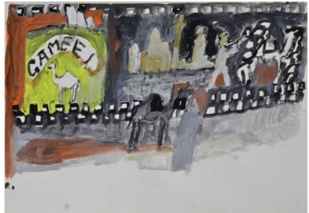
Cotton-Suez Canal, Camel, 2011