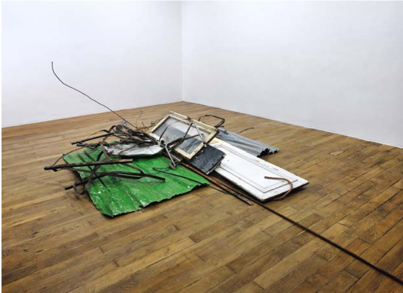
Autodestrucción 3 : Mots et choses, 2013