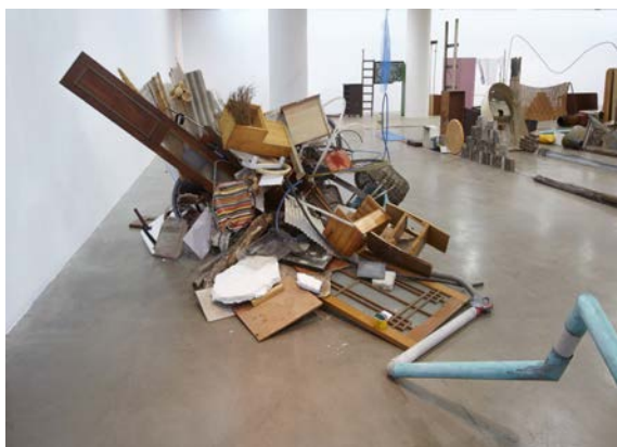
Vue de l'exposition Autodestrucción 8: Sinbyeong, Artsonje Center, Séoul, Corée du Sud, 2015