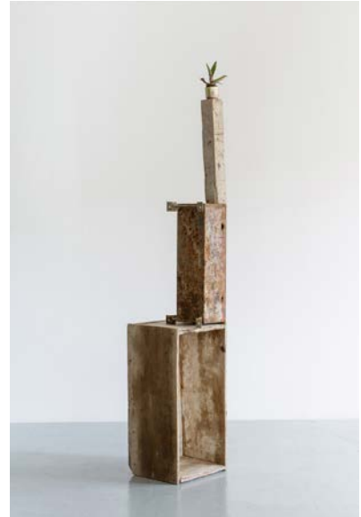
Overzealous self portrait comparing sexual behavior in chimpanzee and bonobo, reading 'Petrolio' by Pier Paolo Pasolini and listening to Outkast 'The Whole World', 2014