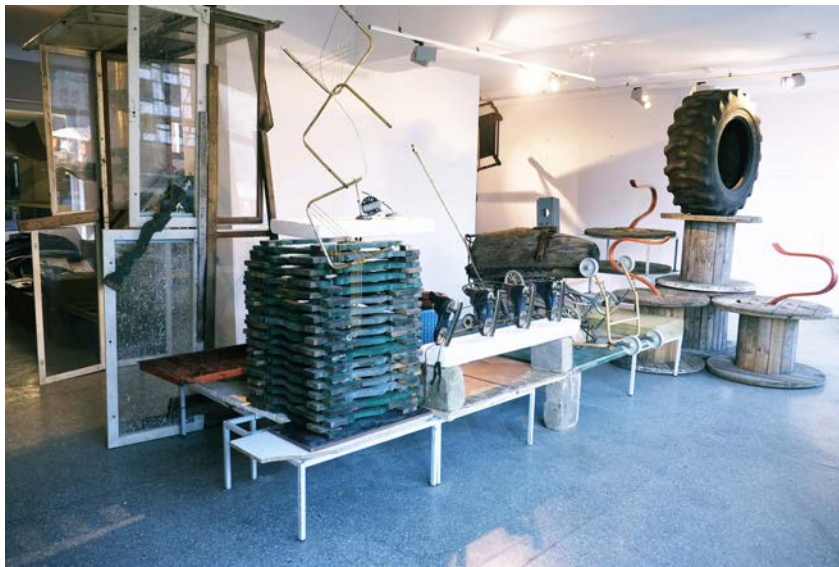
Vue de l'exposition Autodestruccion 6, Gdanska City Gallery 2, Gdansk, 2015